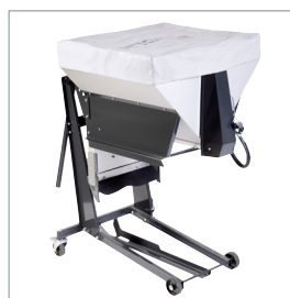
□ Épandeur de sel et de sable