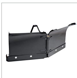
□ Lame chasse-neige en V