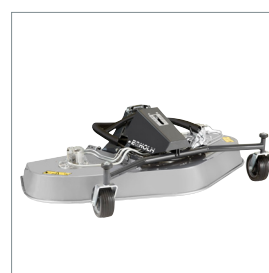
■ Tondeuse rotative ou mulching 1500