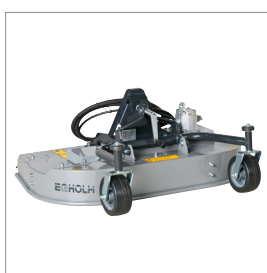
■ Tondeuse rotative, mulching ou collecteur d'herbe 1000