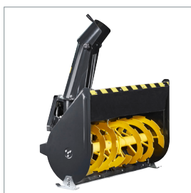
□ Fraise à neige