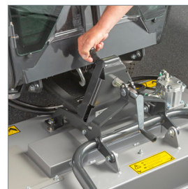
■ Changement rapide d'accessoire sans outil.

Pour plus d'informations concernant le Park Ranger 2155 et ses possibilités d'utilisation, rendez-vous sur www.egholm.fr .