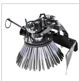
■ Brosse de désherbage