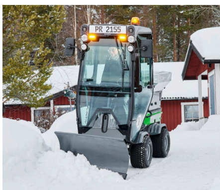
Lame à neige