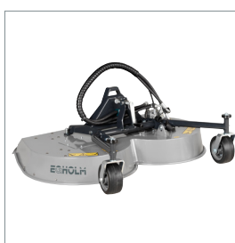
■ Tondeuse rotative ou mulching 1200