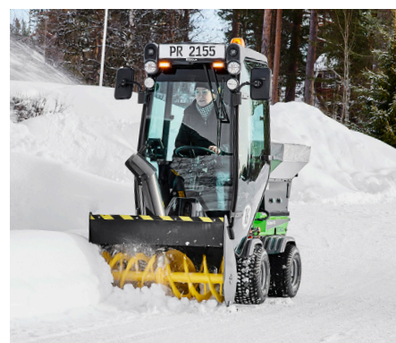
Fraise à neige