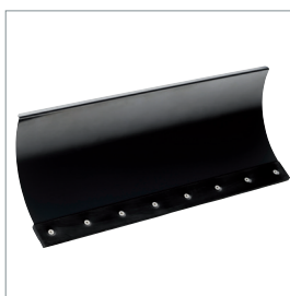
□ Lame à neige